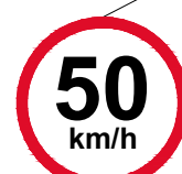
PLANTA DE SINALIZAÇÃO Escala: 1/450